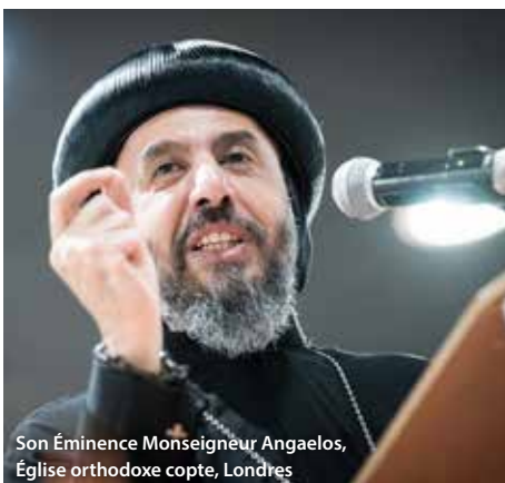
Son Éminence Monseigneur Angaelos, Église orthodoxe copte, Londres