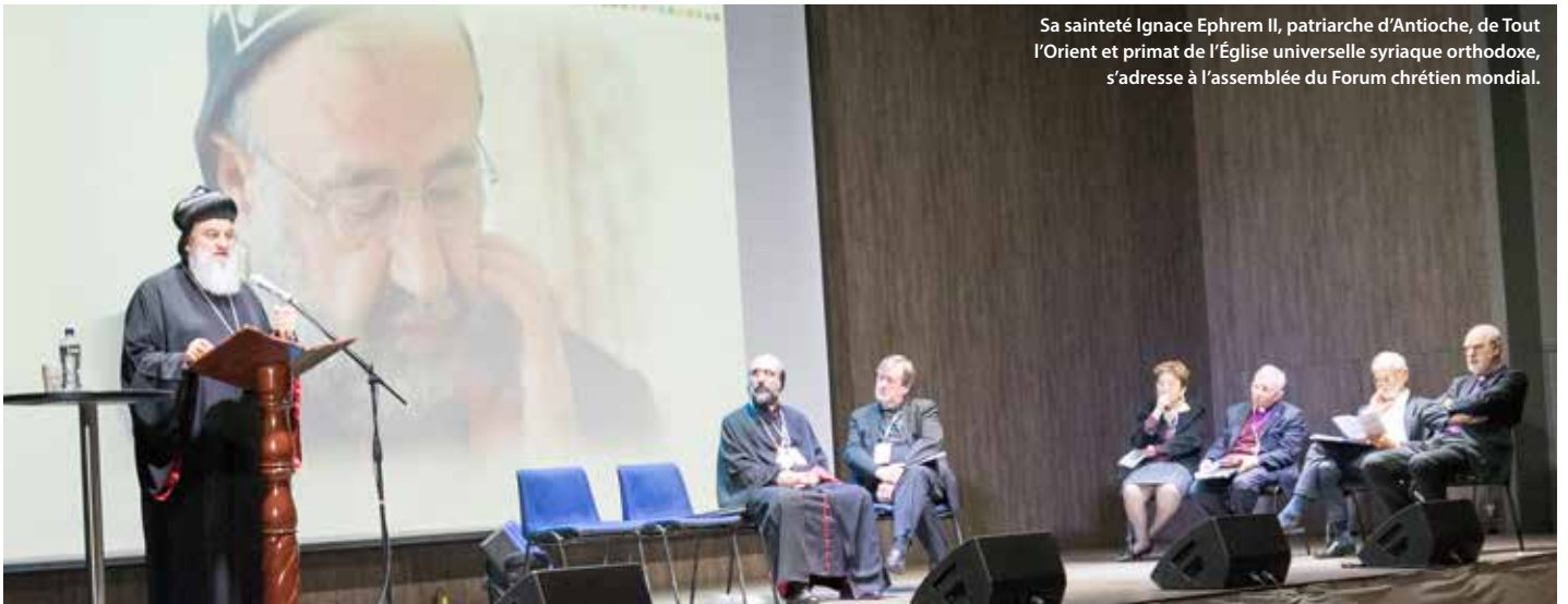
Sa sainteté Ignace Ephrem II, patriarche d'Antioche, de Tout l'Orient et primat de l'Église universelle syriaque orthodoxe, s'adresse à l'assemblée du Forum chrétien mondial.